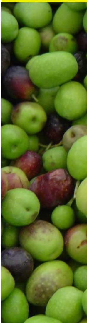
Calendrier Recherche - Expérimentation Filière oléicole 2012