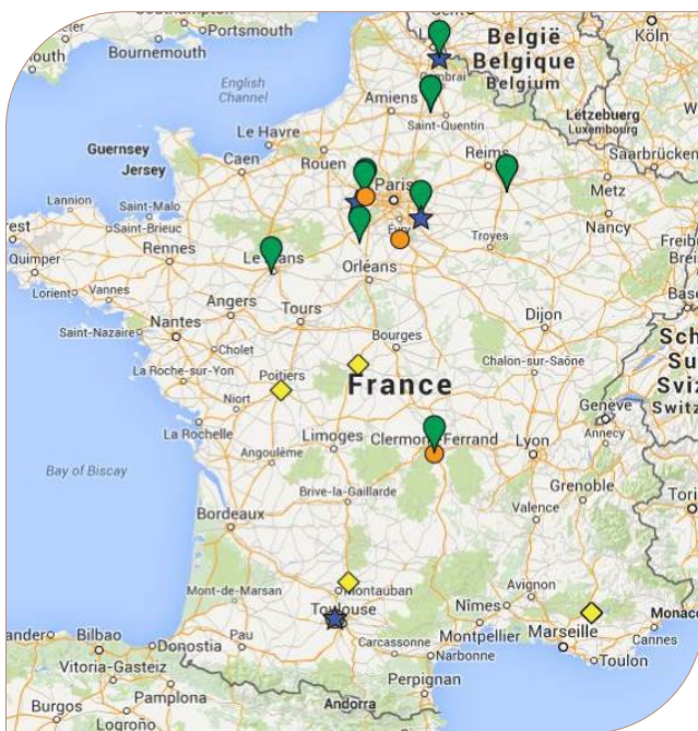
Cartographie des essais BreedWheat

Afin d'être en mesure de disposer de tels outils, il est nécessaire de mettre en œuvre des méthodologies permettant d'identifier les éléments de la plante qui la rendent sensible ou résistante à un stress.