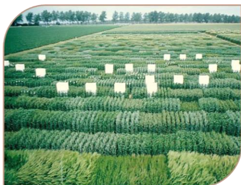
Parcelles d'essais blé tendre BreedWheat

Au final, l'obtention de données phénotypiques fiables et la caractérisation de l'environnement sont des paramètres clés dans l'étude de la diversité génétique de la réponse aux stress sur notre panel de 220 variétés. BreedWheat a mis en place un réseau de 25 essais et produit un jeu de données phénotypiques important afin de répondre aux besoins de la filière.