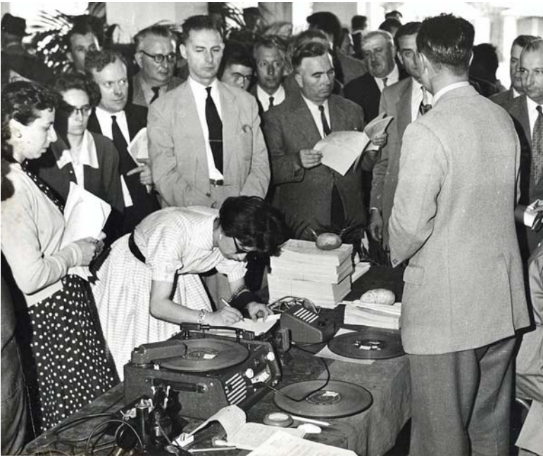
Présentation des matériels du Service des Nouvelles du Marché des Fruits et Légumes (1955)