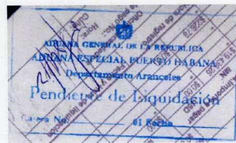
Un autre cachet officiel de la Douane de La Havane