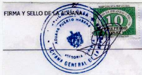
Cachet de la Douane de La Havane