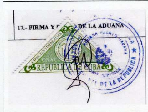
Cachet de la Douane de La Havane apposé sur un autre modèle de timbre fiscal